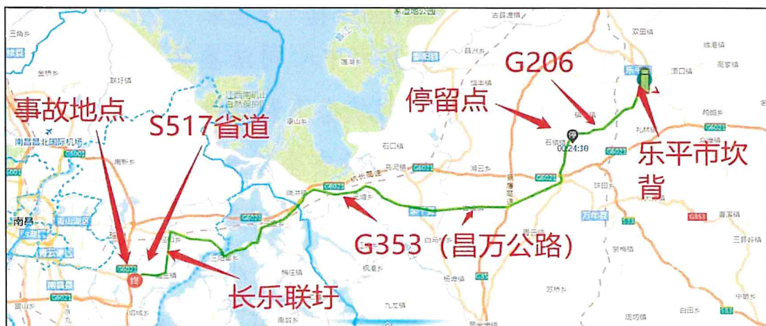
图4 肇事车辆行驶轨迹

4. 肇事车辆行驶轨迹及超限超载检测情况。 肇事车辆1月7日17时9分从景德镇市乐平市坎背出发，途经G206国道、G353国道、长乐联圩堤顶公路、S517省道。期间，为躲避路面治超检查，19时34分至22时37分在上饶市万年县停留3小时3分钟，22时38分再次出发，直至发生事故。沿途先后经过6个不停车检测点，其中南昌县泾口不停车检测点事发前因故障维修暂停使用，其他5个不停车检测点均正常，肇事车辆均采取压中线或逆行的方式躲避检测，故未能准确检测出肇事车辆的载重情况。