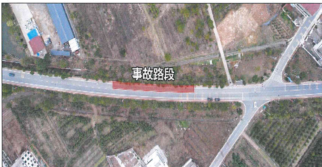
图 1 事故现场道路

线（Y807360121 乡道）南昌县幽兰镇桃岭村路段，由东往西通过路口绿灯后，超速驶入同向路面正在占道开展丧事活动的人群，造成 17 人当场死亡、3 人经抢救无效死亡，19 人受伤。