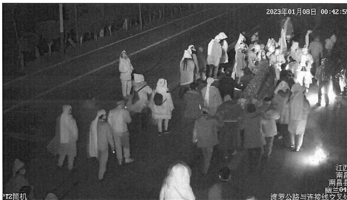
图5 丧事活动占道情况

1月8日0时39分许，送殡队伍在事发道路占道聚集祭拜，祭拜时文明棺摆放在公路北侧半幅路面上，四周聚集亲属、抬棺人、乐队。期间，由于燃放爆竹烧纸钱，形成了短时大量烟雾。