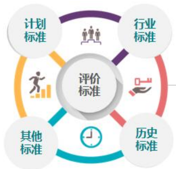
图一绩效评价标准一览图

本次项目绩效评价标准采取计划标准、历史标准及其他标准相结合，计划标准包括项目年初制定的预算绩效目标申报表及项目预算安排；该项目为延续性项目，历史标准参考往年项目实施数据；其他标准，如《关于印发 2021 年度南昌市供销发展专项资金项目的通知》（洪供发〔2021〕34 号）。